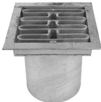
40 tons rist