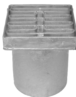
25 tons rist