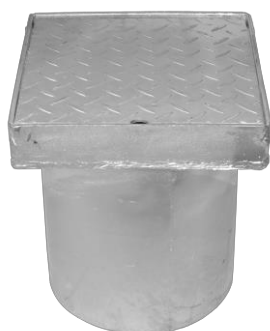
2,5 tons dæksel