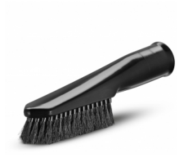
SUGEBØRSTE - BLØD - DN 35