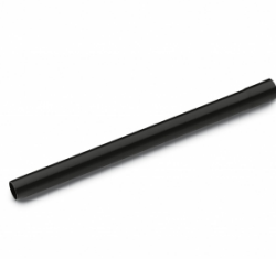
Forlængerrør, 35 mm