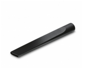
Ekstra langt fugemundstykke (350 mm)