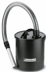
Askefilter til grovmuds