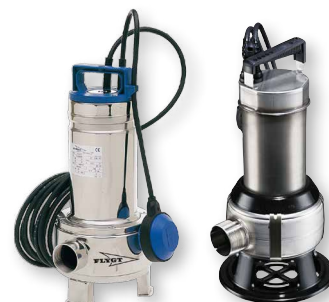
Flygt DXM35-5 og Grundfos AP35B

Ønskes større pumper, anden rørføring eller større brønde kan WaterCare være behjælpelig med dette.