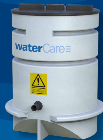
Skurvogsbrønd, VN: 223190607SK/609

Det er lovpligtigt med en alarm i pumpebrønden i tilfælde af pumpevigft. Se mere herom på side 10.