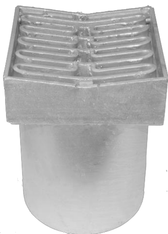
Karmål: 320 x 300 mm